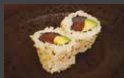
Uramakis rouleau de riz à l'exté- rieur et algue à l'intérieur