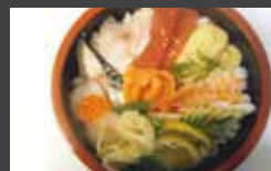
Chirashi grand bol de riz vinaigré avec sashimi de poisson posé par-dessus