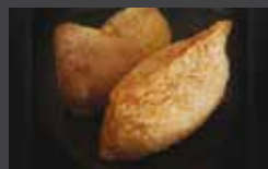
Inari sushi tofu frit en ragoût