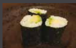
Fosomaki rouleau de feuille d'algue avec du riz à l'intérieur