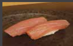
Nigiri sushi boulette de riz avec du poisson cru posé par-dessus